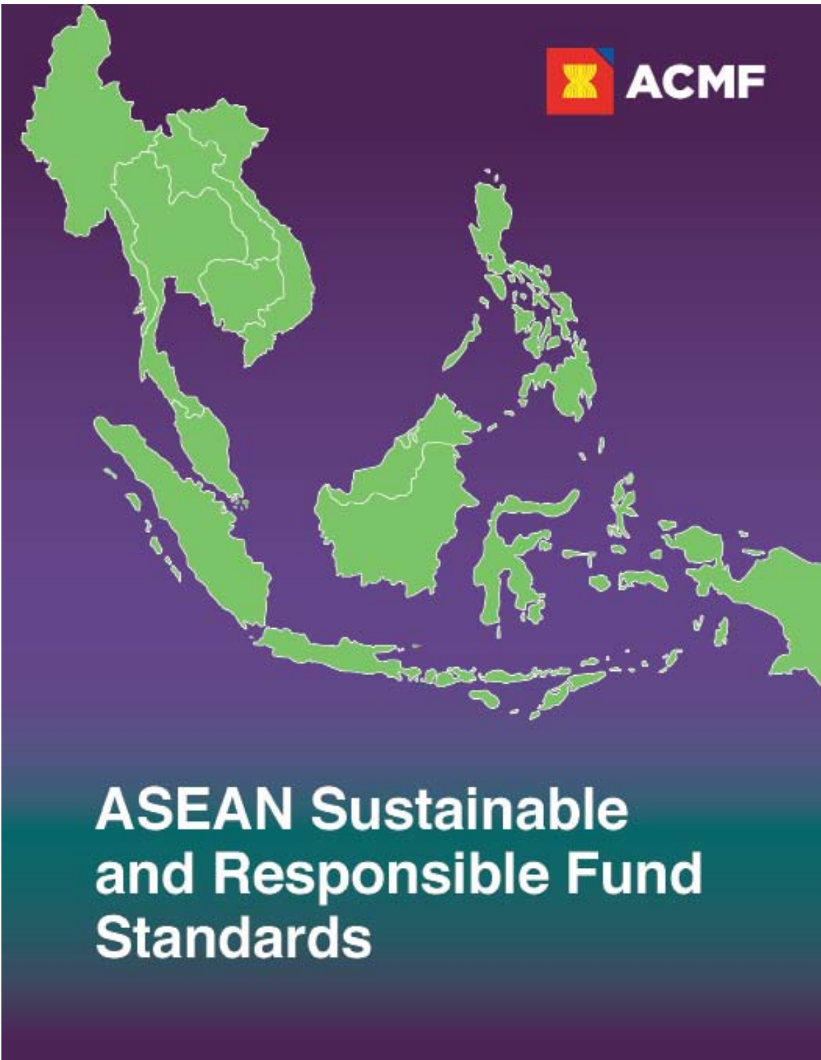
ASEAN SRFS តម្រង់ឆ្ពោះទៅរកការសម្រេចឱ្យបាននូវគោលដៅអភិវឌ្ឍន៍ប្រកបដោយនិរន្តរភាព។

ASEAN SRFS មានគោលបំណងផ្តល់នូវលក្ខខណ្ឌតម្រូវនៃការបង្ហាញព័ត៌មាន និងការរាយការណ៍ជាអប្បបរមា ដែលតម្រូវឱ្យអនុវត្តជាប់លាប់សម្រាប់គម្រោងវិនិយោគរួម (Collective Investment Schemes - CIS) ដែលស្នើសុំជា ASEAN SRFS ដោយសារតែមានការកើនឡើងនៃ CIS ដែលផ្តោតលើការវិនិយោគ ESG និងតម្រូវការសម្រាប់ការប្រៀបធៀប, ភាពរួមតែមួយ និងការបង្ហាញព័ត៌មាន ប្រកបដោយតម្លាភាព ដើម្បីកាត់បន្ថយហានិភ័យនៃការក្លែងបន្លំភាពបៃតង (greenwashing) ព្រមទាំងជួយវិនិយោគិនក្នុងការសម្រេចចិត្តលើការវិនិយោគឱ្យបានត្រឹមត្រូវ។ ក្នុងន័យនេះ CIS ឬប្រតិបត្តិករ CIS ត្រូវតែអនុលោមតាម ASEAN SRFS ដែលផ្តល់នូវការបង្ហាញព័ត៌មានបន្ថែមនៃ CIS ដែលមានលក្ខណៈគុណវុឌ្ឍិគ្រប់គ្រាន់។ លក្ខណៈសំខាន់នៃ ASEAN SRFS ក) ការដាក់ឈ្មោះ ឈ្មោះរបស់ CIS ដែលមានលក្ខណៈគុណវុឌ្ឍិគ្រប់គ្រាន់ត្រូវតែមានភាព-